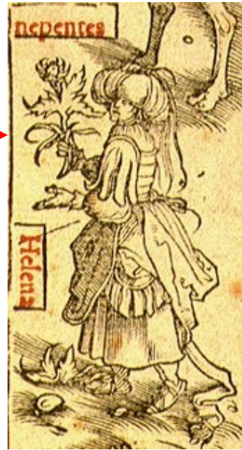
Hélène de Troie tient une plante magique, le népentes, dont le suc a dissipé le chagrin de Télémaque, et qui serait en fait une préparation à base d'opium, Dioscoridae pharmacorum simpliciorum reique medicae libri VIII